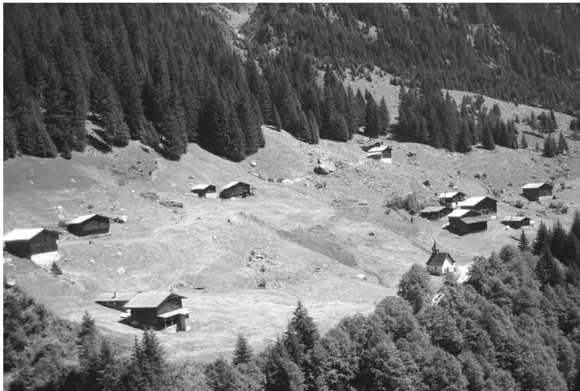
Run ella Val Sumvitg