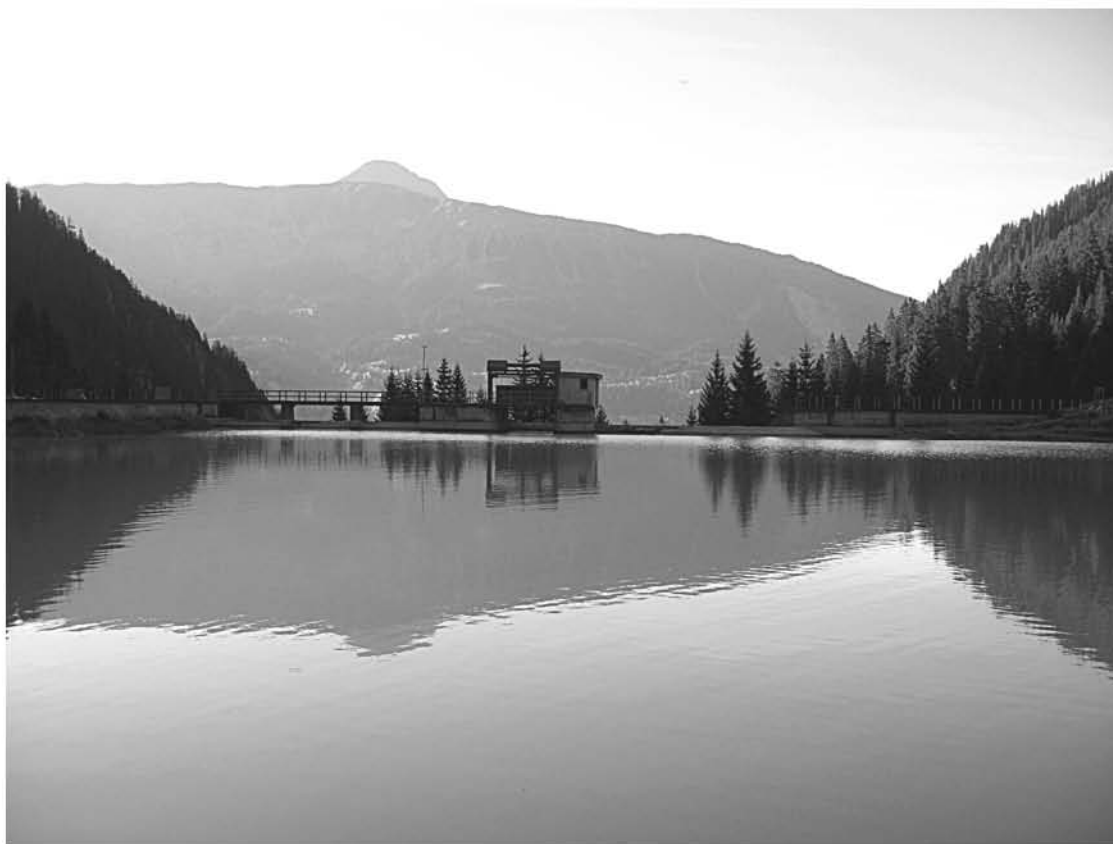
Lag da fermada Barcuns