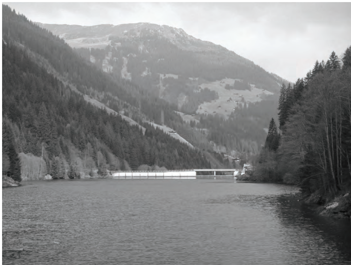
Lag da fermada Runcahez