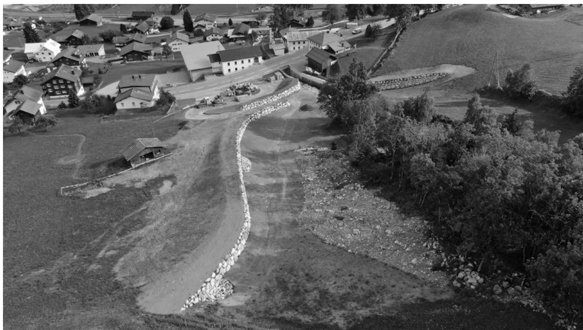
rempar Val Luven