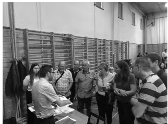
Workshops "Avegner vischnaunca Sumvitg" diils 26 d'ust 2023