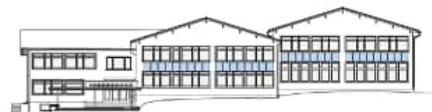
Südansicht Schulhaus 1:500, Fläche PV = 34m 2